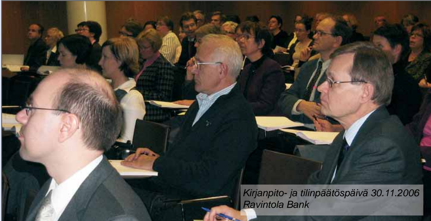
Kirjanpito- ja tilinpäätöspäivä 30.11.2006 Ravintola Bank