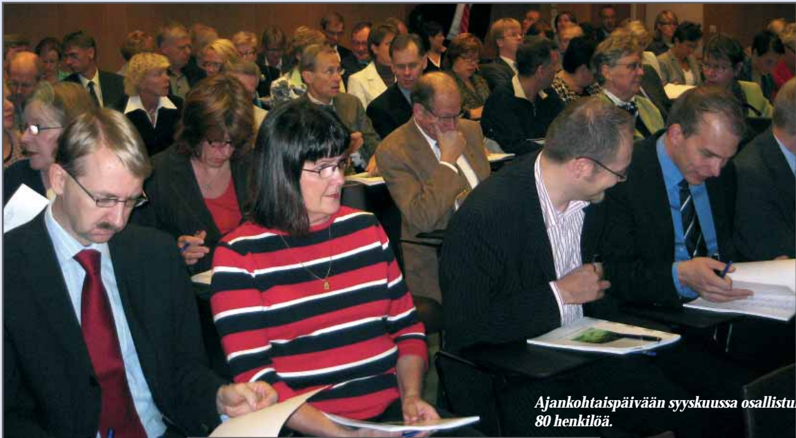
Ajankohtaispäivään syyskuussa osallistui yli 80 henkilöä.

Eläkesäätiöyhdistyksen eläkesäätiöille ja eläkekassoille suunnattuihin syksyn koulutustilaisuuksiin osallistui yhteensä noin 250 henkilöä ja niissä kuultiin 35 alustusta. Lämmin kiitos kaikille mukana olleille!