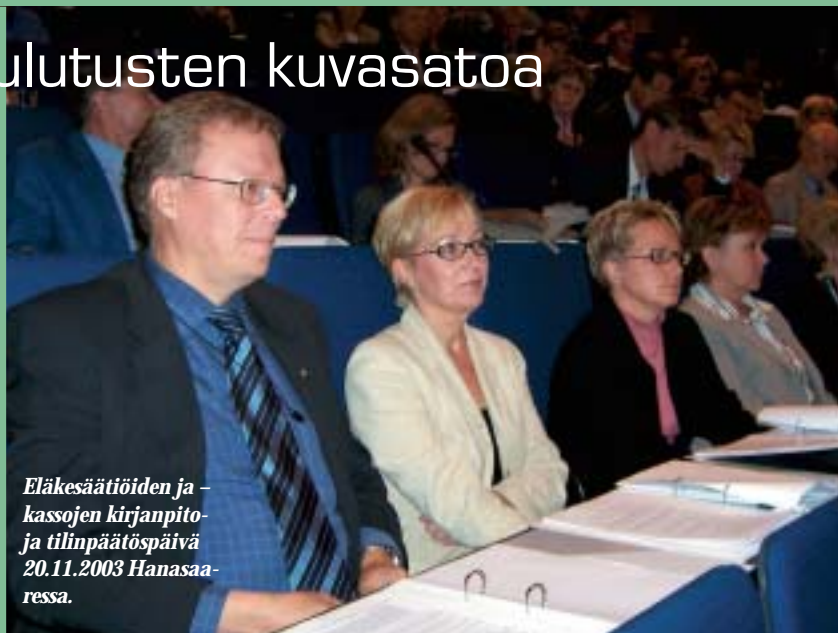
Eläkesäätiöiden ja -kassojen kirjanpito- ja tilinpäätöspäivä 20.11.2003 Hanasaaressa.