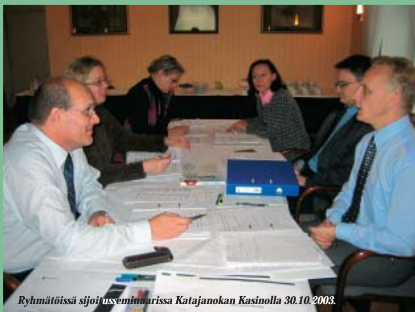
Ryhmätöissä sijoitusseminaarissa Katajanokan Kasinolla 30.10.2003.