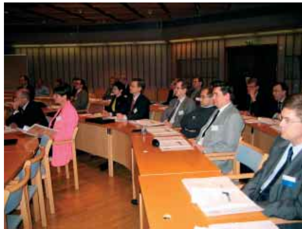
Eläkesätiöiden ja -kassojen hallitusten jäseniä koulutettiin 10.-11.3. Hanasaaren kulttuurikeskuksessa.

Vakuutuskassalakea muutetaan siten, että eläke- kassojen jäsenyys Vakuutuskassojen Yhdistykses- sä muuttuu vapaaehtoiseksi. Samalla Vakuutus- kassojen Yhdistyksen yhteydessä toimivan vakuu- tuskassalautakunnan toimivaltaa rajoitetaan yhdistykseen kuulumattomien eläkekassojen osalta.