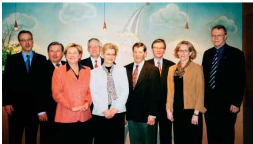
ja vanhan hallituksen jäseniä.